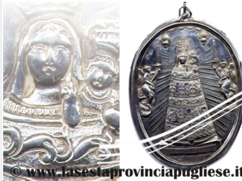
...: A sinistra un particolare della Madonna di Loreto; a destra il medaglione con su raffigurante la Madonna di Loreto.